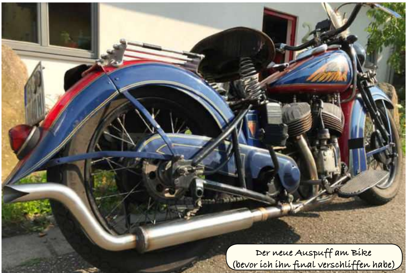
Der neue Auspuff am Bike (bevor ich ihn final verschliffen habe)